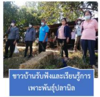
ชาวบ้านรับฟังและเรียนรู้การ เพาะพันธุ์ปลานิล