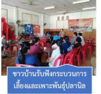
ชาวบ้านรับฟังกระบวนการ เลี้ยงและเพาะพันธุ์ปลานิล