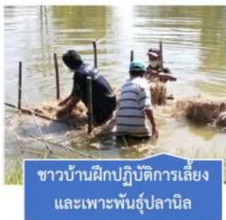
ชาวบ้านฝึกปฏิบัติการเลี้ยง และเพาะพันธุ์ปลานิล