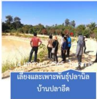
เลี้ยงและเพาะพันธุ์ปลานิล บ้านปลาอีด