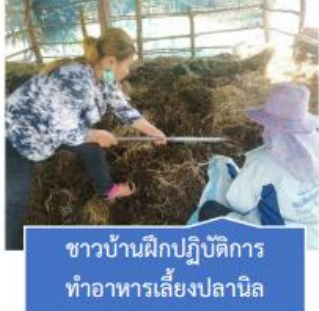
ชาวบ้านฝึกปฏิบัติการ ทำอาหารเลี้ยงปลานิล