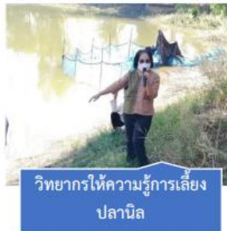
วิทยากรให้ความรู้การเลี้ยง ปลานิล